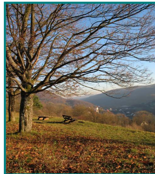
Auf der „Wied „ mit Blick auf Pommelsbrunn